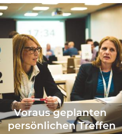
Voraus-geplanten persönlichen Treffen

Schließen Sie sich unserem Geschäftstreffen, bei dem 150 internationale Unternehmen teilnehmen werden an.